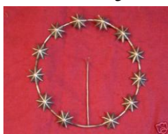
Uno Stellario (diverso da quello ordinato)

(Campetto Sportivo, via S. M. La Stella, 1)