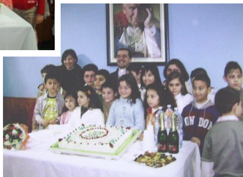
28 febbraio 2008