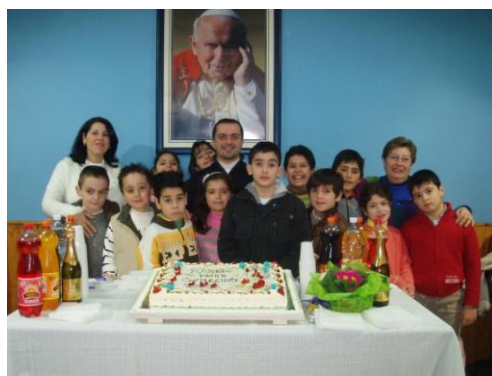
22 febbraio 2008