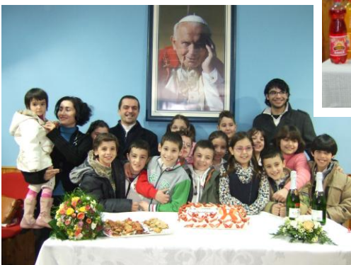
07 marzo 2008

Prime Confessioni in parrocchia nei venerdì di quaresima: